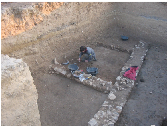
núcleo precedente romano y tardorromano.